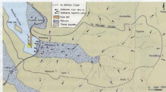
Orhaniye Kızkumu'nun oluşumu

kusuz daha da arttıracak ve koruma bilincinin gelişmesine yardımcı olacaktır.