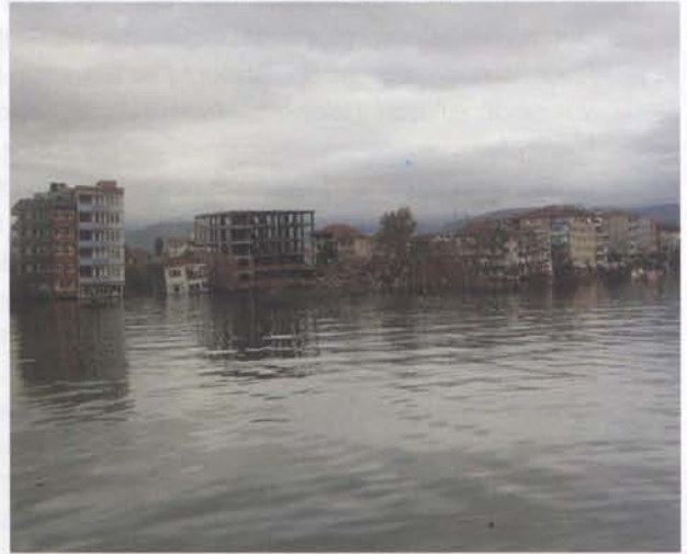
17 Ağustos 1999 depremi sonrası Gölçük