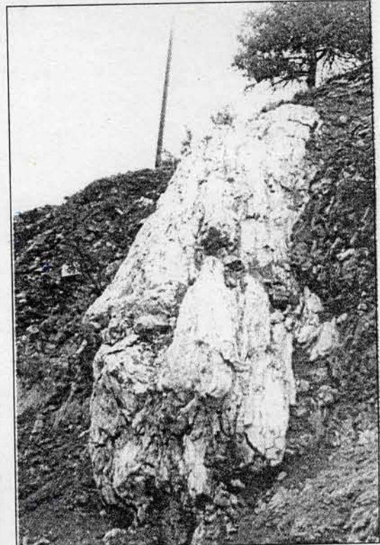
Toprak altında kalan fosil ağaçların, gerekli kazı çalışmalarının ardından gün yüzüne çıkarılması planlanıyor.