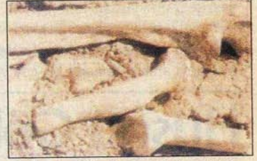
Nekropolün bulunduğu alan içinde bulunan kemik parçaları

çaları da mezarlara ölü hediyesi olarak bırakılmış olan kaplara aittir. Nekropolün hangi antik yerleşim yeri ile ilgili olabileceğinin araştırılması yapıldığında, nekropol alanının yaklaşık 1 km kuzeydoğusunda antik çağlarda Paissos olarak bilinen bir antik kentin var olduğu öğrenilmiştir. Günümüzde Lapseki'ye bağlı Adatepe köyünün kuzeyinde bulunan Paissos'ta hiçbir mimari kalıntı bulunmamakla birlikte, yüzeyde MÖ 3. Binden MS 4. Yüzyıla