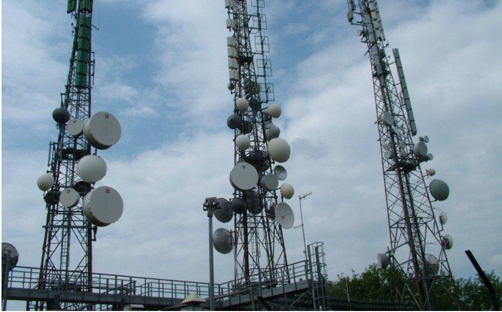
Yüksek gerilim hatları (YGH) ve direkleri

BU YAZI HBT PORTALINDA 30 Nisan 2016 TARİHİNDE YAYIMLANMIŞTIR.