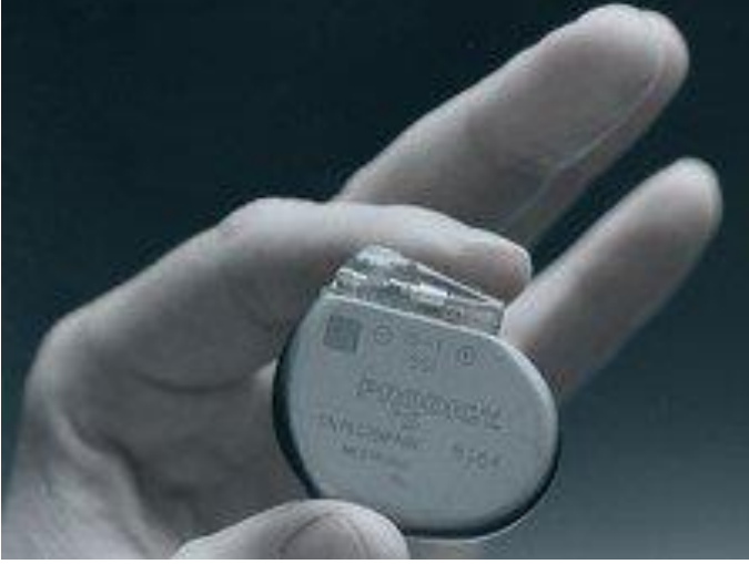
Kalp pili örneği